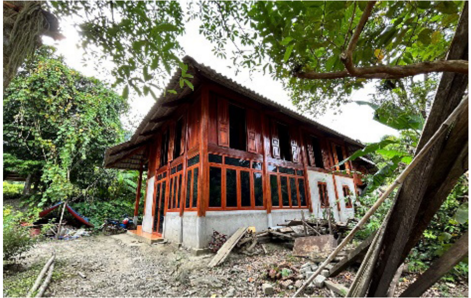
Nhà ở xóm Bắc Thung, xã Quyết Chiến