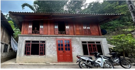
Nhà ở xóm Hương, xã Vân Sơn