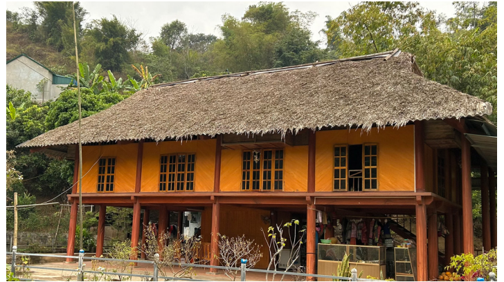
Homestay bản Giang Mỗ, huyện Cao Phong

Nhà ở biến đổi thành dạng nhà ở kết hợp hoạt động du lịch cộng đồng