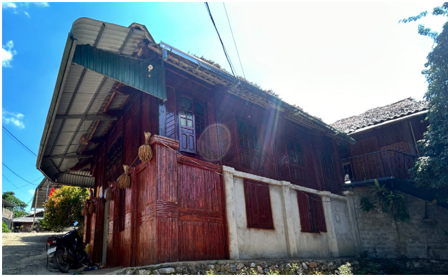
Homestay Hải Thạn, xóm Chiến, huyện Tân Lạc