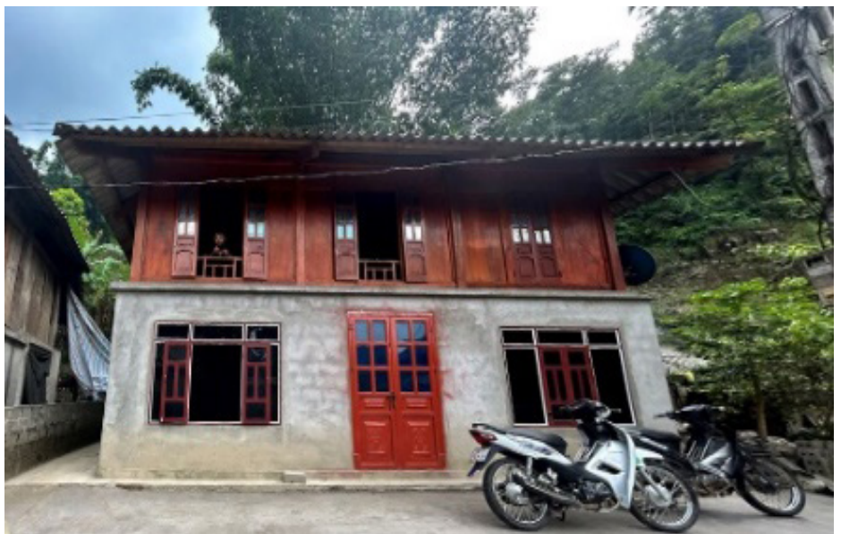
Biến đổi nhà ở tại huyện Cao Phong, huyện Tân Lạc