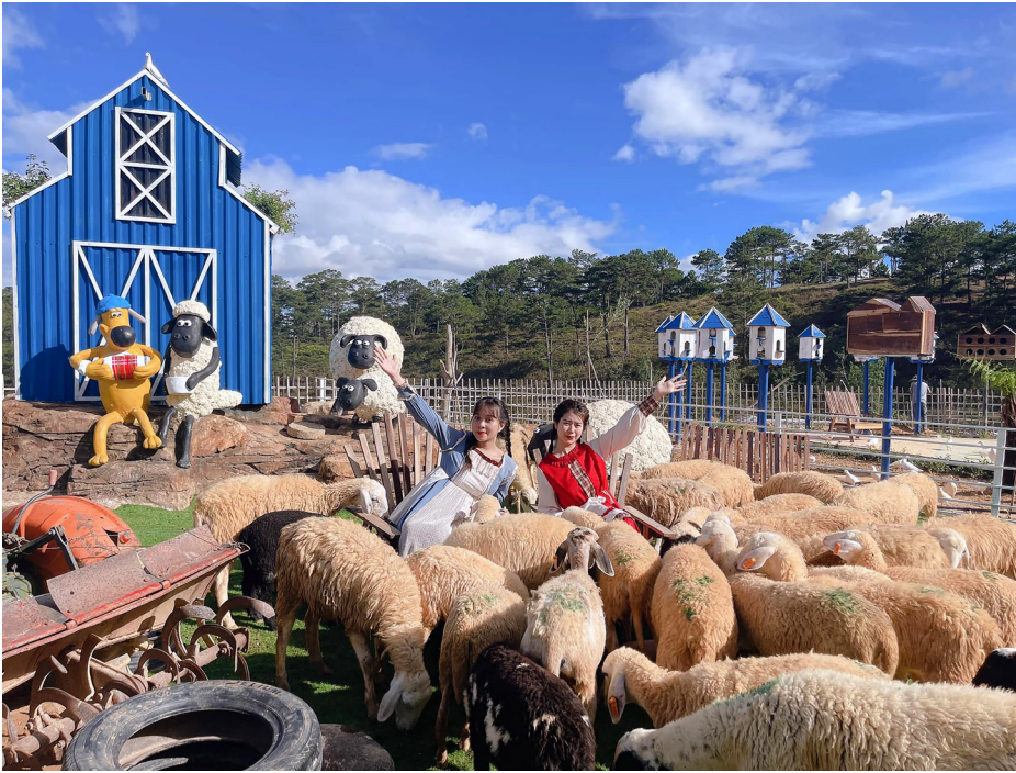
Trải nghiệm Nông trại cừu tại thành phố hoa Đà Lạt mộng mơ